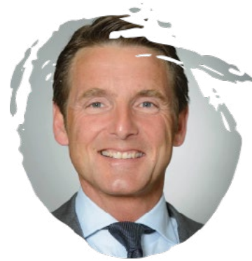
Z.H. Prins Maurits van Oranje - Nassau Ondernemer